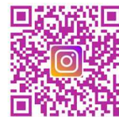
勝どきキンダーガーデン (未就学児)