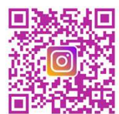
勝どきアフタースクール (小学生)