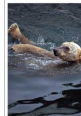
The polar bear can swim.